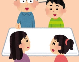
未来共創ワークショップ