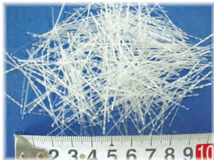
【和歌山県認定リサイクル製品登録】 コンクリート・モルタル補強用PET(R)非鋼繊維 『テレフタロンAC』

「ひし形金網」・「クリンブ金網」・「各種エキスパンドメタル」・「法面緑化用型枠」の製造販売 「コンクリート・モルタル補強用PET(R)非鋼繊維」の製造販売