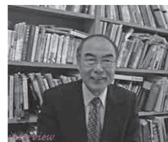
長期総合計画審議会会長 近畿大学生物理工学部教授