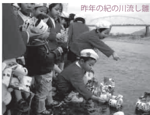
昨年の紀の川流し雛

■上映協力券販売場所…粉河ふるさとセンター、貴志川生涯学習センター、麦の郷 紀の川・岩出生活支援