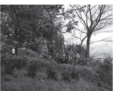
春には、ピンク色に染まった桃畑を眼下に、多くの人がハイキングを楽しみます。

けに衰退し荒廃していきました。昭和のはじめ、これを憂いた有志らみごとに復興させました。昭和4年のことです。旧竹房橋の完成とも重なり、その繁栄ぶり、打田駅から百合山まで人の列が続くほどだったともいわれます。しかし、それもつかの間、戦争で再び荒廃してしまいました。 昭和の終わりごろ、再び百合山新四国八十八カ所再興の気運が高まり、昭和62年に結成された「百合山の自然と遺跡を生かす会」によって荒廃していた遍路道やほこらが整備されました。2度の再興を経て、現在は大切に活かされています。