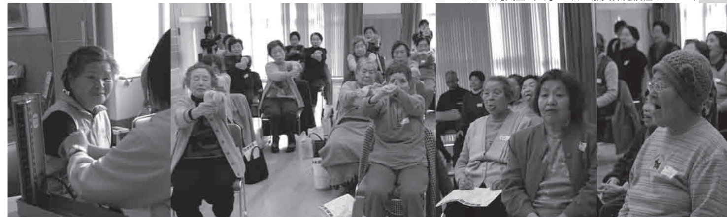
いきいき元気塾 (1月16日 那賀保健福祉センター)

【問い合わせ】栄寿苑居宅介護支援センター (Tel 75・6888) 高齢介護課介護予防係 (Tel 75・5314)