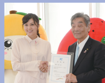
⑮フルーツ大使の委嘱状を交付