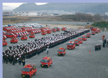
②約1,400人で組織された消防団