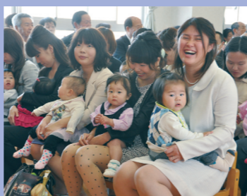
⑩民営化後、笑顔で迎える初入园