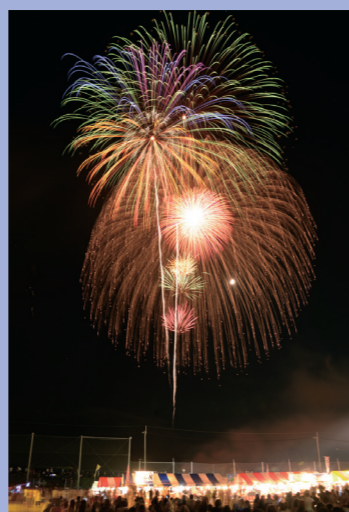
④夜空を彩る3,000発の夢花火