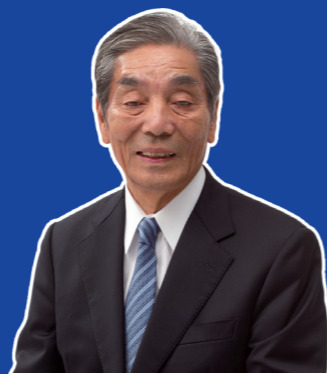
紀の川市長 中村慎司

今後とも、皆さまのご支援とご協力を賜りながら、更なる発展と活力あるまちづくりをめざして、邁進してまいりたいと考えております。