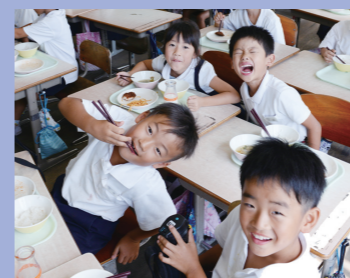
⑭毎日笑顔でいただきます！