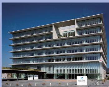
⑫免震構造を採用した新庁舎