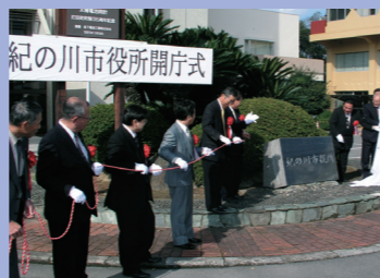
①旧打田町役場での開庁式