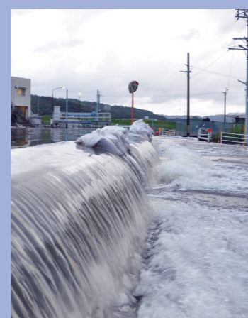
⑧排水が追いつかず道路へ越水した調月幹線1号排水路