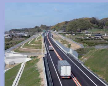
⑬紀の川市東毛から西向き展望