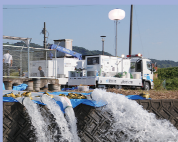
⑨ポンプ車2台で30m 3 /分を排水