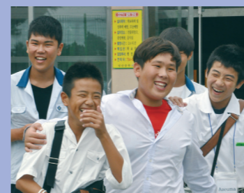
⑥海の向こうにできた友達 中学生たちの海外派遣交流