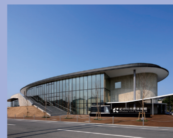
⑯周辺一帯を市民公園として整備