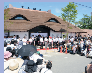
⑦ねこの顔をイメージした駅舎