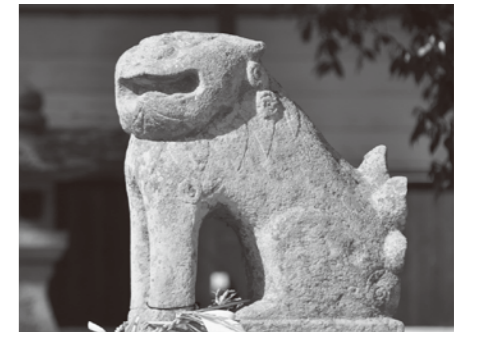
日吉神社の鳥居前にあるユーモラスな表情の狛犬

す。正面中央に千鳥破風を設け、更に軒に唐破風を取り付けるなど豪華な造りになっています。軒下や社殿の彫刻も大変細かく、柱上部から組物にかけては極彩色、軒や縁周りは紅柄塗と塗り分けられています。建立年代を直接示すような資料はありませんが、本