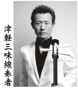
津軽三味線奏者 木乃下 真市 ◎きのした・しんいち 和歌山県出身。津軽三味線全国大会で2年連続優勝。伝統芸能である津軽三味線に現代的音楽を取り入れ、津軽三味線の可能性を追求し続け、国内外で圧倒的支持を得ている。