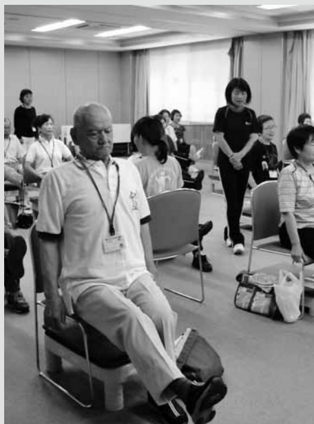
ピンシャン元気教室～イスを使って筋トレ～