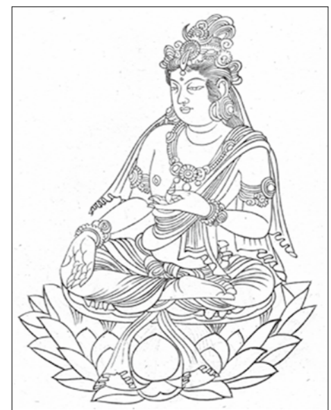
曼荼羅に描かれた菩薩像