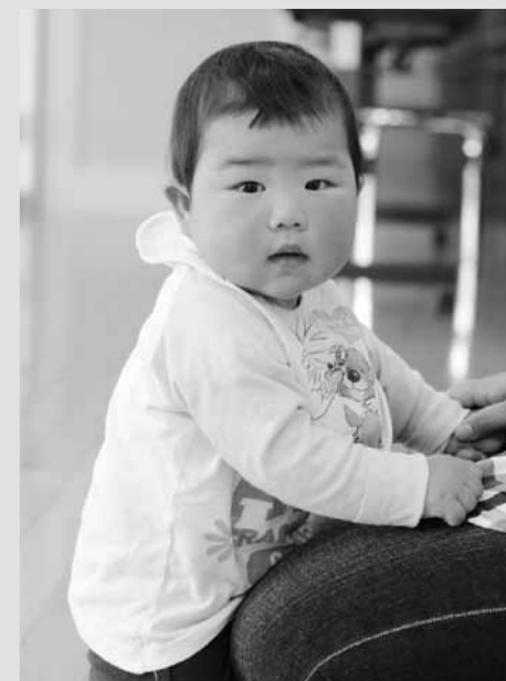
4月10日 1歳児健康相談