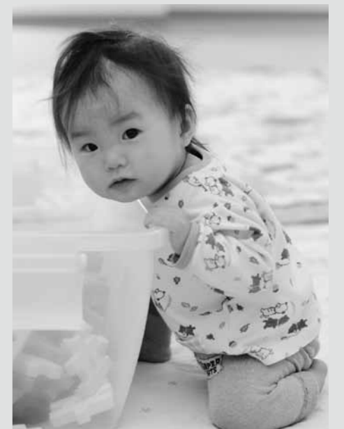
4月11日 1歳児健康相談