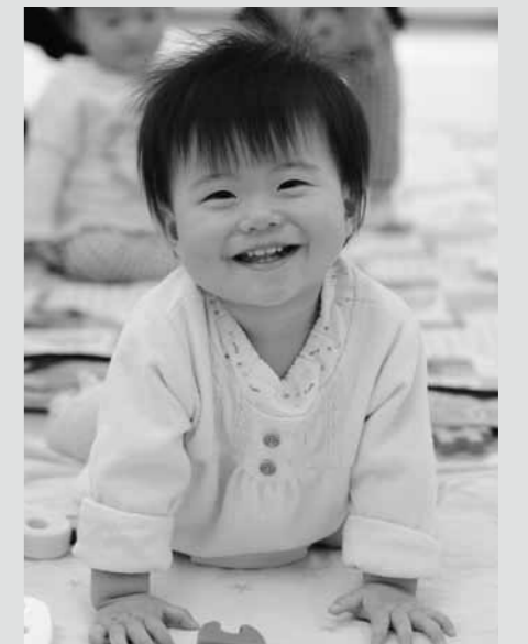
4月11日 1歳児健康相談