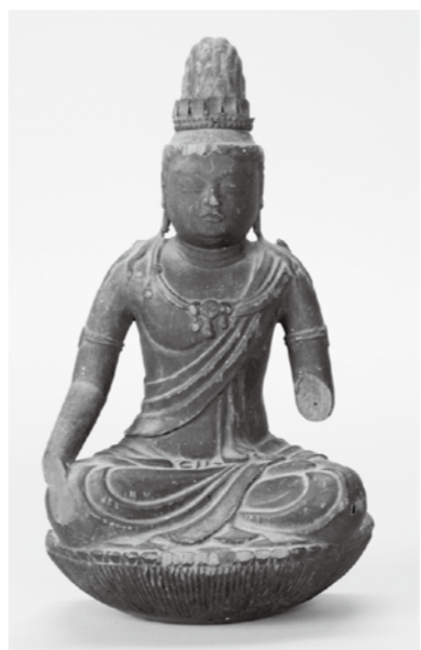
林ヶ峯観音寺菩薩形坐像