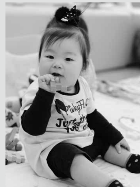
4月11日 1歳児健康相談