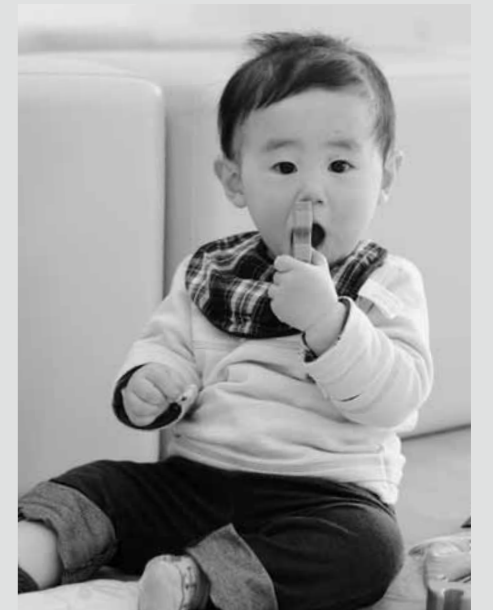
4月10日 1歳児健康相談