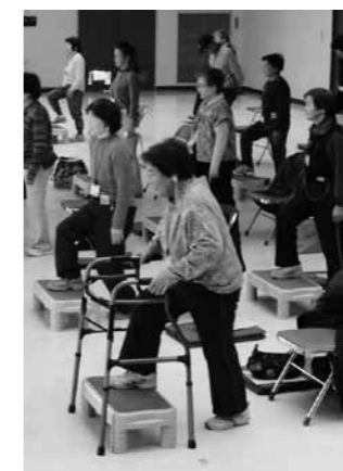
運動器機能向上教室の風景