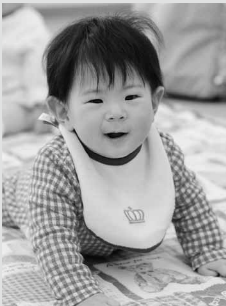
4月11日 1歳児健康相談