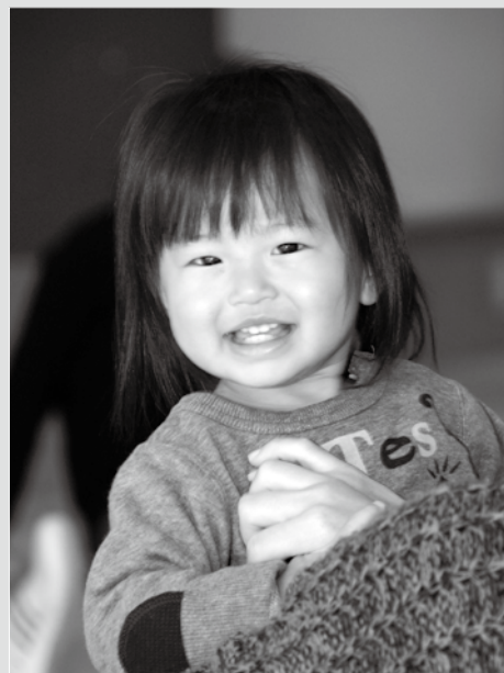
12月11日 赤ちゃん広場