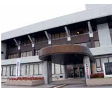
紀の川市貴志川町神戸 327 番地 1

と自立を支えていく滞在型の図書館として運営します。 特徴は、飲み物の持ち込みができる55席の「学習コーナー」。自習や飲食を禁止している図書館が多い中、図書館にある本以外の本を使って学習することができます。また、多くの雑誌を気楽に楽しめるラウンジコーナーでは、ゆったりとした時間を過ごしていただけます。 じっくり学び、ゆったり過ごす。自分にあったスタイルをお楽しみください。