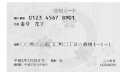
「通知カード」の場合の本人確認