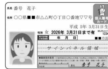
「個人番号カード」の場合の本人確認

1月から社会保障・税・災害対策の行政手続きで、順次、マイナンバー(個人番号)の利用が始まります。市では、次の手続きで市役所の窓口でマイナンバー(個人番号)の記入が必要ですので、「個人番号カード」または「通知カード」を持参ください。なお、窓口では本人確認が必要ですので、本人確認書類を用意ください。