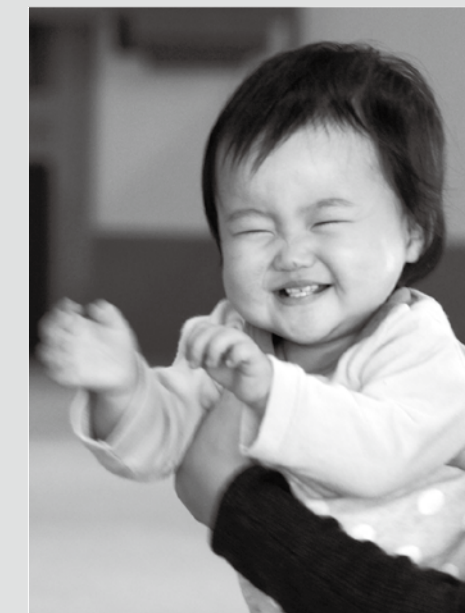
12月11日 赤ちゃん広場

子育て支援センターは、子育てに関する相談や情報交換、親子の遊び場、交流の場として、子育てを応援します。気軽にご利用ください。