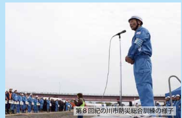
第8回紀の川市防災総合訓練の様子