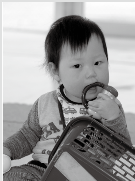
12月11日 赤ちゃん広場