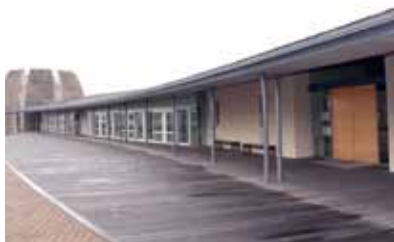
紀の川市西大井 363 番地

河北図書館は、旧称を打田図書館といい、平成17年に建築されました。83,465冊が蔵書されており、利用者みなさんが気軽に利用できる開放的な雰囲気を感じています。