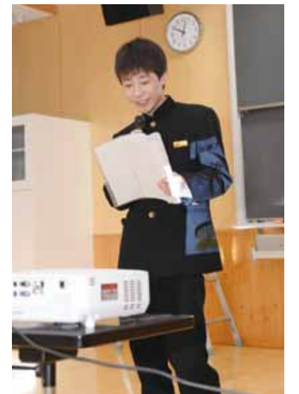
選挙演説し、主張を訴える立候補者役の生徒。

選挙管理委員会は、「立候補者の主張や公約を知って、自分も政治を担う一員だという意識を持って投票に行ってもらいたい」と、未来の有権者たちに期待していました。