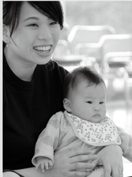
12月11日 赤ちゃん広場