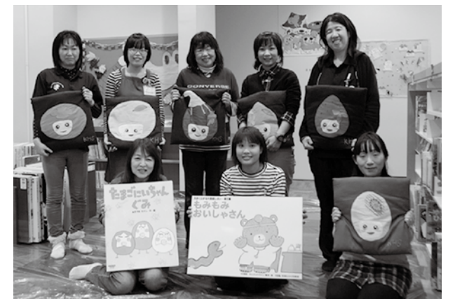
図書館で働く職員

CD、DVDなど、五感で楽しむ資料がたくさんあります。字が嫌いだからといって図書館を避けるのではなく、何気なく訪れてみてください。みなさんの好奇心をくすぐるような、豊かなくつろぎの空間がそこにはあります。きっと新しい発見が待っていますよ。