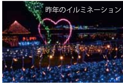
昨年のイルミネーション