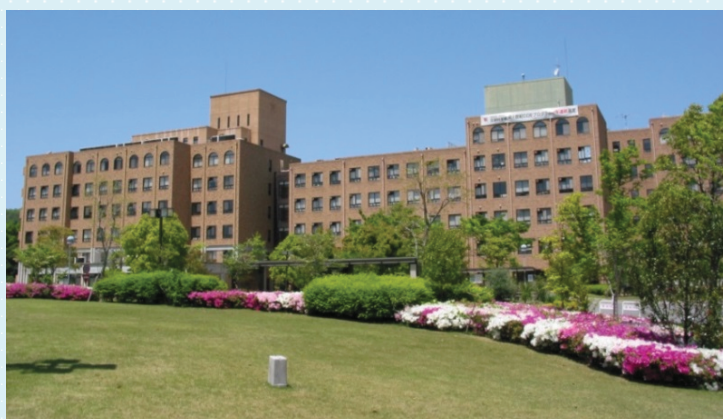
近畿大学生物理工学部キャンパス