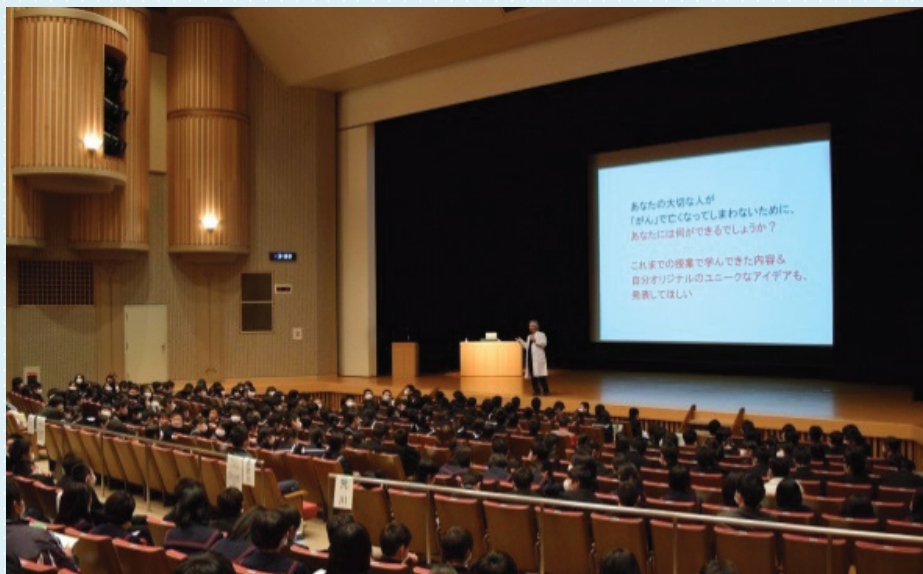
特色ある学校教育：「世界一受けたいがんの授業」風景 (市立中学2年生の全生徒対象)