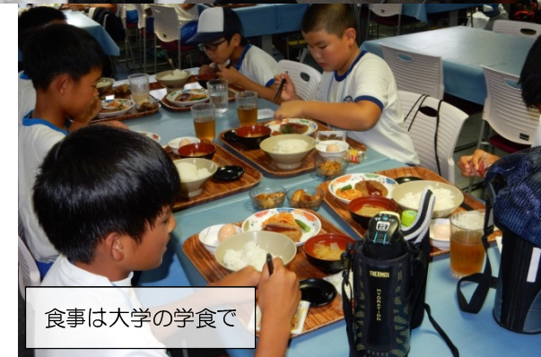
食事は大学の学食で