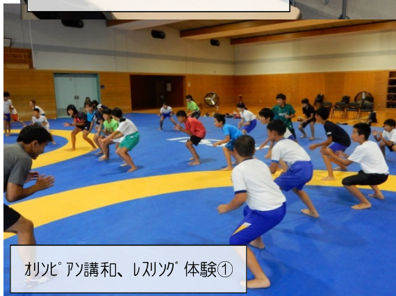
柔道講和、レスリング体験①