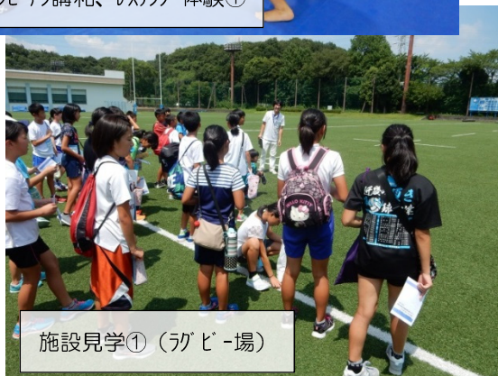
施設見学①（ラグビー場）