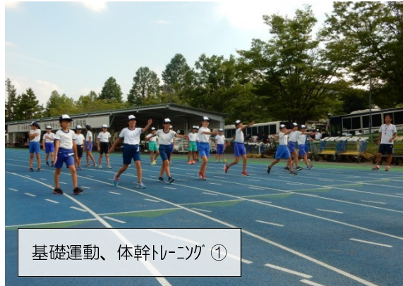
基礎運動、体幹トレーニング①