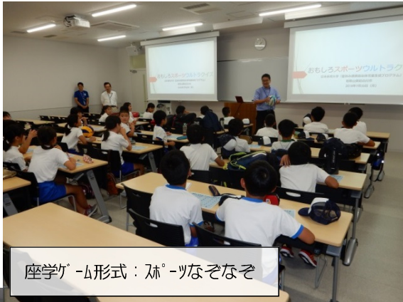
座学形式：おもしろスポーツワトランス

紀の川市と日本体育大学との「体育・スポーツ振興に関する協定書」（平成 27 年 2 月締結）に基づく交流事業として、小学 6 年生 30 名（男子 15 名・女子 15 名）が 7 月 30 日～31 日の 2 日間、日本体育大学へスポーツ体験や見学・学習に行ってきました。先進的な体育施設の見学、専門的な知見をお持ちの先生方やトップレベルの指導者、選手との交流により一層スポーツへの関心を高めることができました。