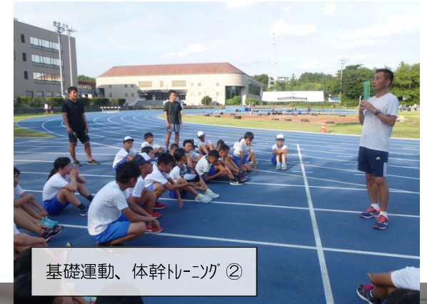
基礎運動、体幹トレーニング②