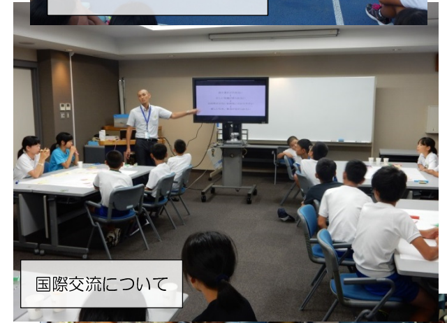
国際交流について