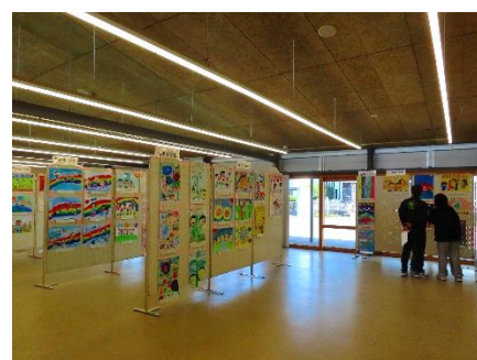
▲ 令和6年度開催時の展示会の様子

紀の川市教育委員会では、子どもや地域の方々が絵画に触れながら、人権を身近な問題として意識してもらう場を提供し、人権尊重の精神を日常生活に実現していくことを目的として人権啓発ポスター展を開催しています。