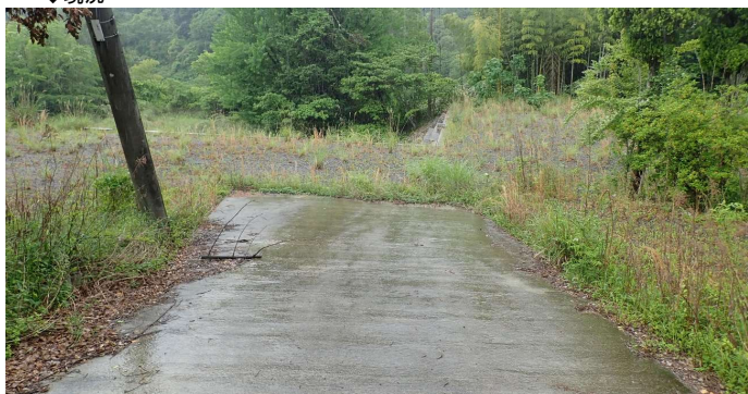
①校舎・体育館跡、フェンスで囲まれている。