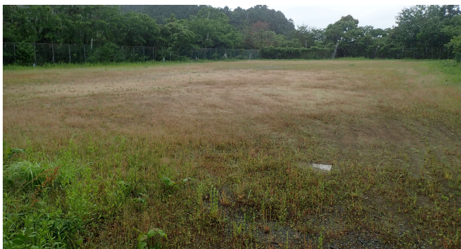
②グラウンド跡、フェンスで囲まれている