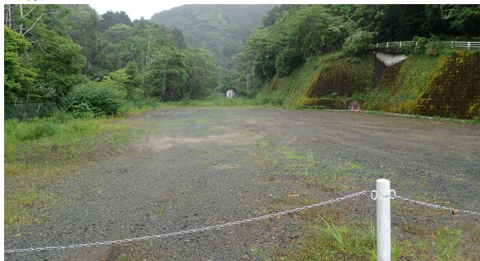
①道路より東側 奥に基地局が見える