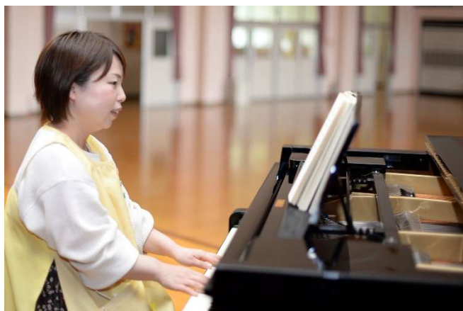
こども課 こばと保育所 令和2年入庁 保育士