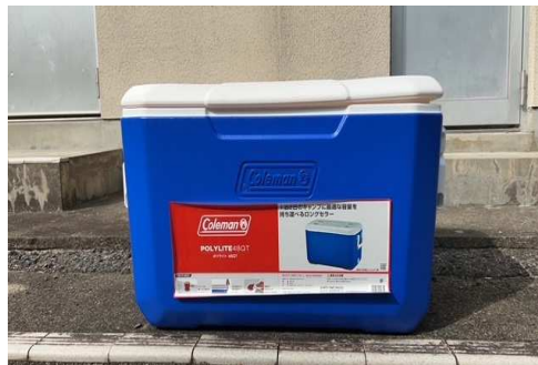
クーラーボックス