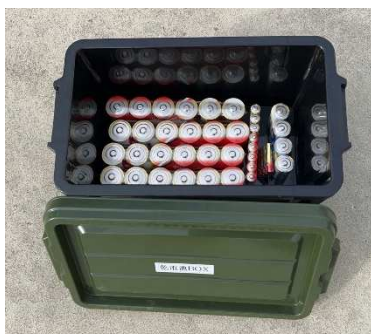
乾電池入りボックス