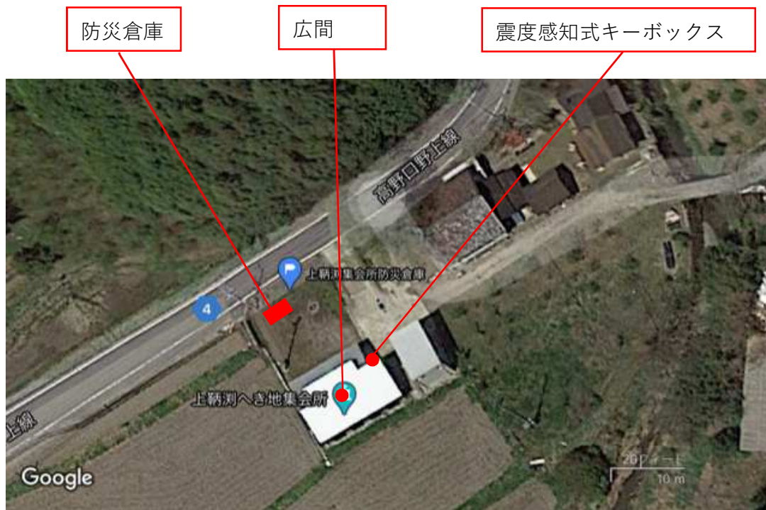
震度感知式キーボックス・防災倉庫位置