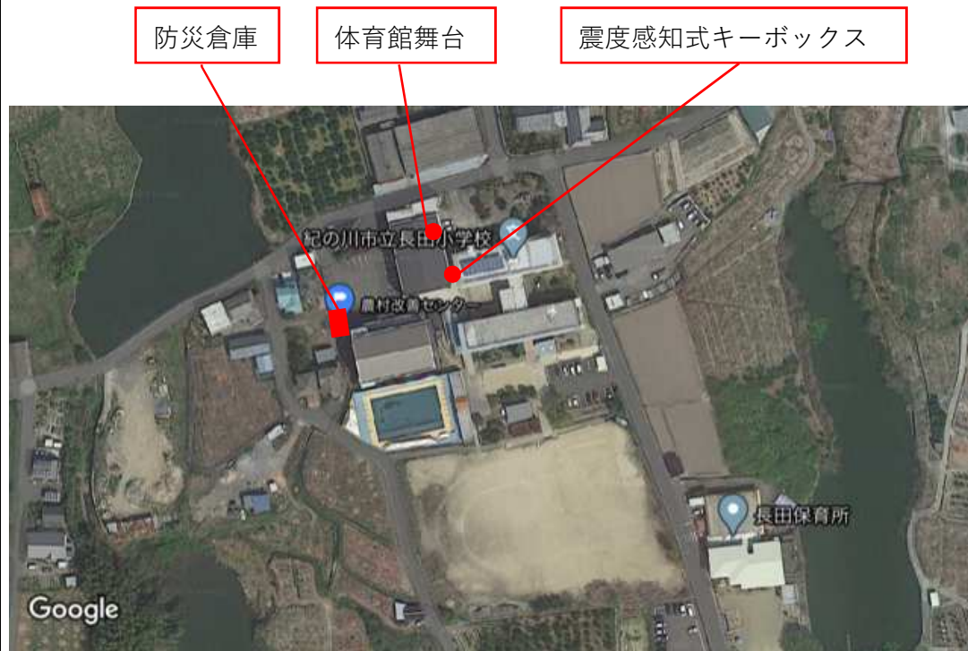
震度感知式キーボックス・防災倉庫位置