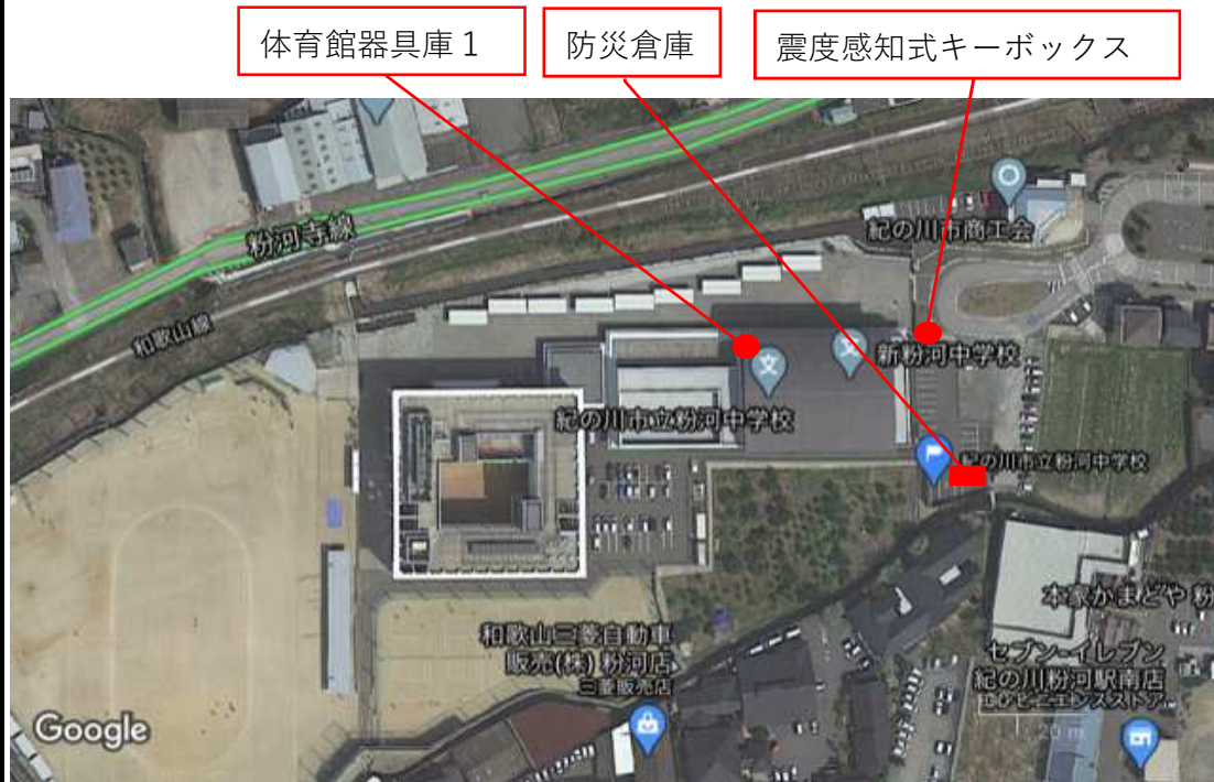
震度感知式キーボックス・防災倉庫位置