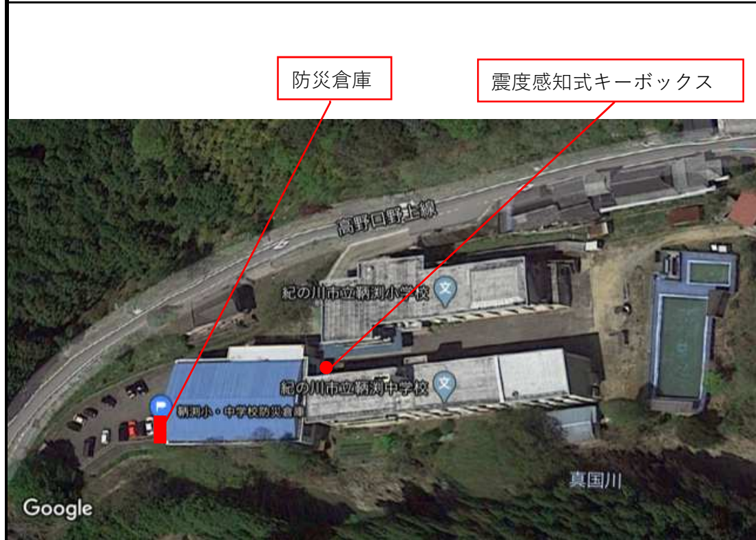
震度感知式キーボックス・防災倉庫位置