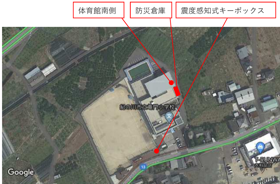
震度感知式キーボックス・防災倉庫位置