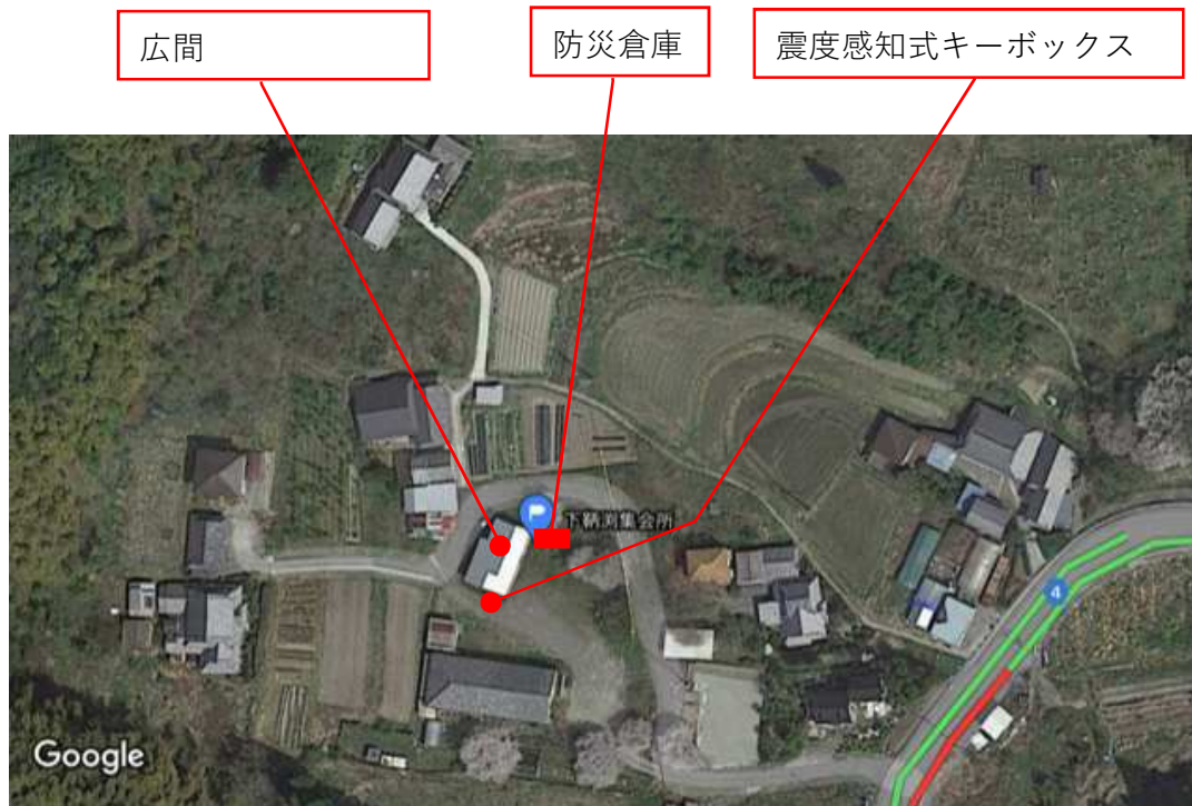
震度感知式キーボックス・防災倉庫位置