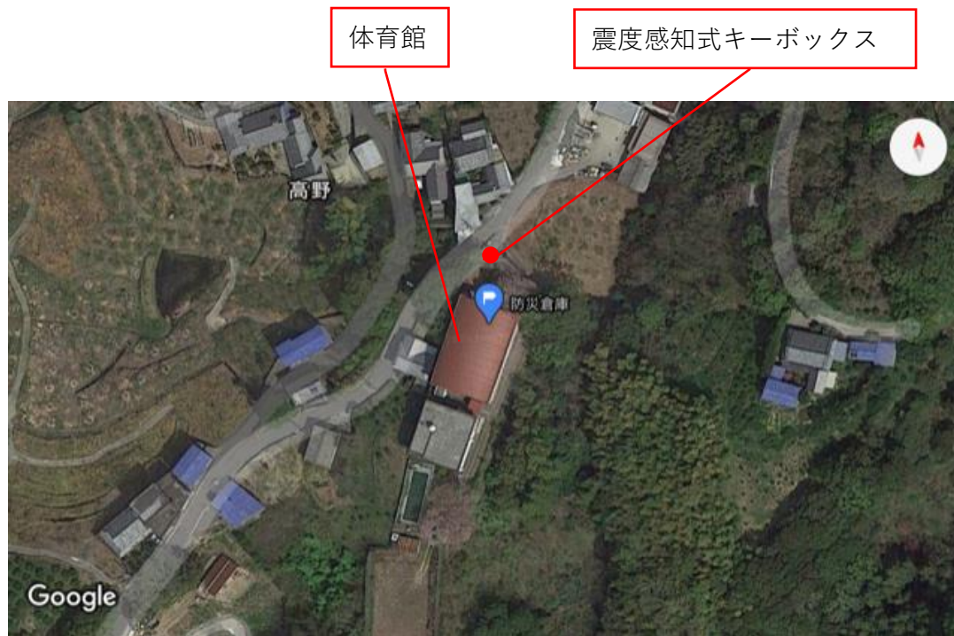
震度感知式キーボックス・防災倉庫位置