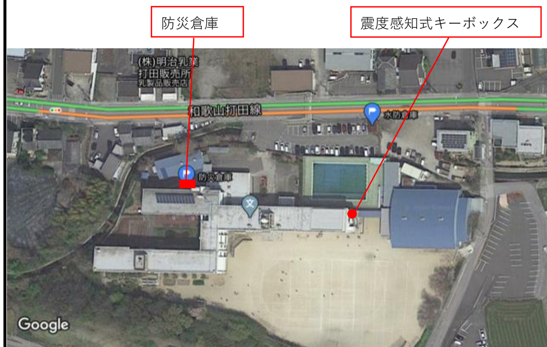
震度感知式キーボックス・防災倉庫位置