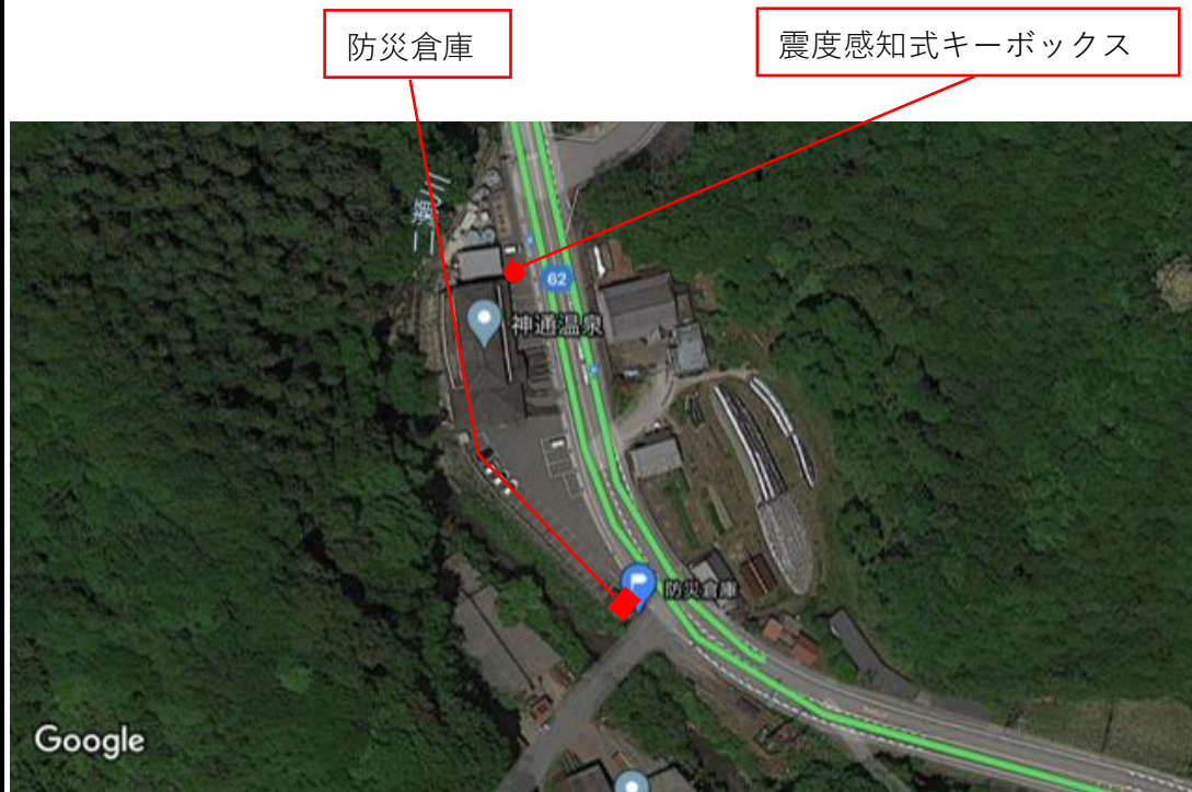
震度感知式キーボックス・防災倉庫位置