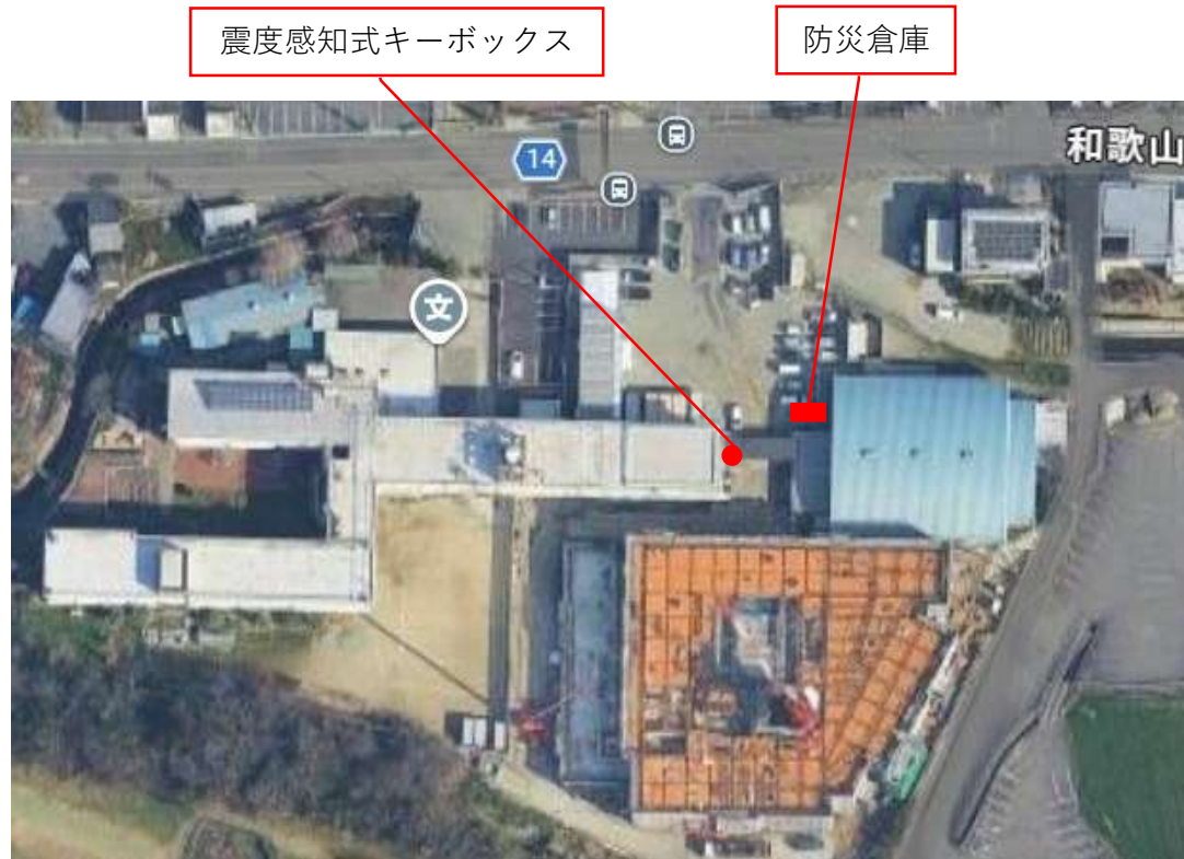
震度感知式キーボックス・防災倉庫位置