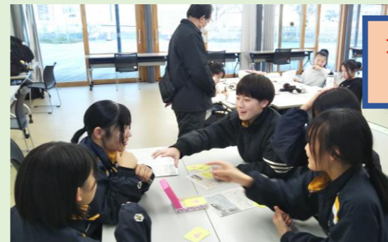
文化祭に参加してくれた中学生たちが 友達を連れて来て来てくれています!