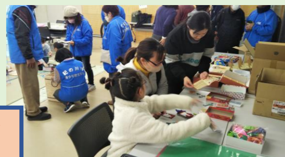
「ウポンゴ」というカードゲームを 親子で楽しんでいます!