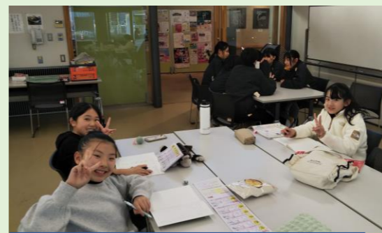
「まずは宿題を済ませたから」っと!