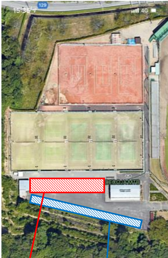
テニス利用者優先枠