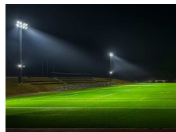
夜照明設置(200ルクス)