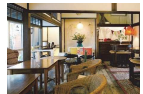
古民家を活用したカフェ