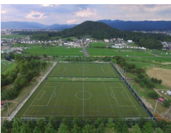
周囲への防球ネットの整備 フェンスとラインの間隔確保(5m)