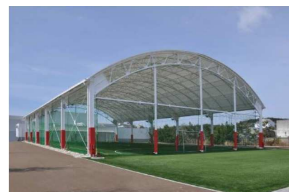
屋根付きフットサルコート