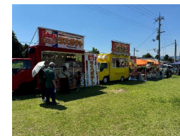
キッチンカーの来店