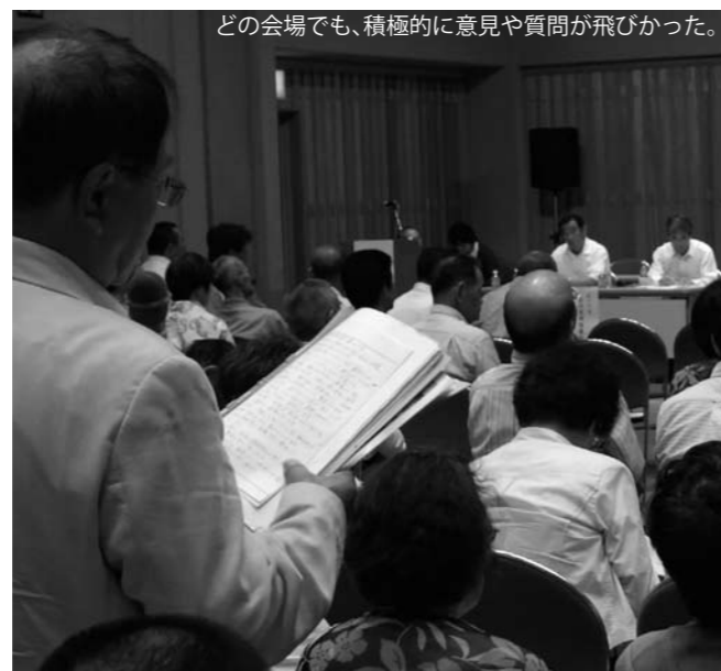
どの会場でも、積極的に意見や質問が飛びかった。

しかし、全ての保育所で統一した単価となっていて、国の基準がある中、現在、国の基準の80%で設定しています。今後、近隣自治体の状況などを見ながら、十分検討研究したいと考えています。