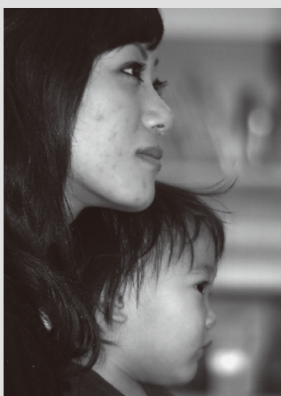
11月6日 赤ちゃん広場