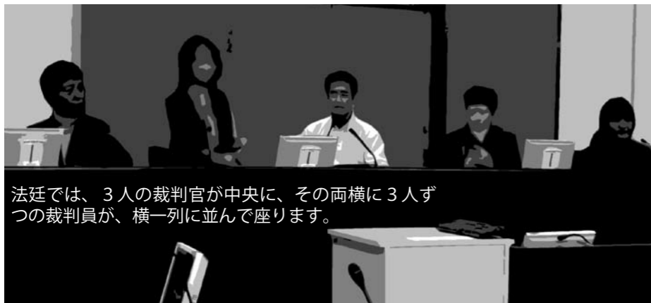
法廷では、3人の裁判官が中央に、その両横に3人ずつの裁判員が、横一列に並んで座ります。