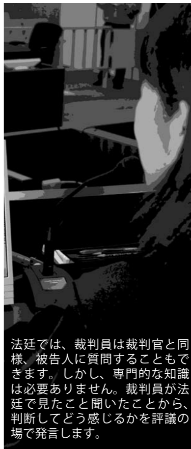
法廷では、裁判員は裁判官と同様、被告人に質問することもできます。しかし、専門的な知識は必要ありません。裁判員が法廷で見たこと聞いたことから、判断してどう感じるかを評議の場で発言します。

※4 70歳以上、学生、重い病気やけが、檢察審査員（過去5年以内に務めたことがある）などにあてはまる場合は、裁判員になることを辞退できます。また、仕事の都合で辞退を希望する場合は、候補者が仕事を休むことで起こる影響を、総合的に判断し、裁判長が辞退を認めるかどうか決めます。