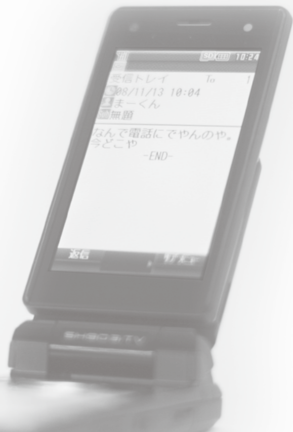
デートDVでは、携帯電話による「行動を逐一報告させられる」「メールをすぐに返さないと怒られる」「異性のアドレスを消すように言われる」などの束縛や干渉が多い。

夫婦以外の男女間で起こるDVは、年齢を問わずデートDVと呼ばれることがあります。監禁や殺傷などの痛ましい事件に発展して、私たちの目に触れることも少なくありません。