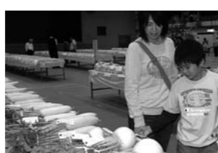
まちかど写真館 11月15日・16日産業まつり

■入場券販売場所：貴志川生涯学習センター(月曜・祝日・年末年始は休館) 粉河ふるさとセンター(土日・祝日・年末年始は休館) 【問い合わせ】貴志川生涯学習センター(Tel 64・2273)