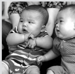
6月8日赤ちゃん広場

広報紀の川や市ホームページであなただけのお店の宣伝をしませんか？ 広報広聴課（TEL 77・0813）