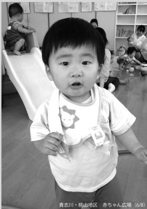
貴志川・桃山地区 赤ちゃん広場(6/8)