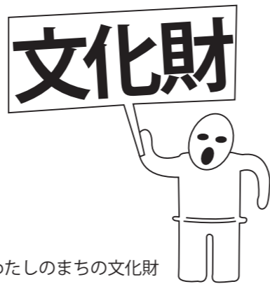
わたしのまちの文化財