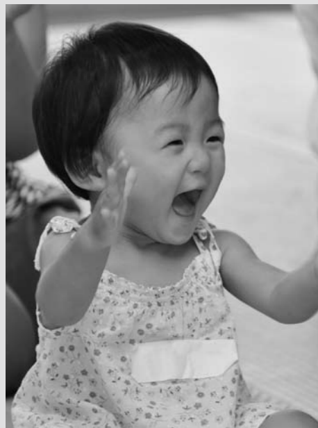
8月9日 赤ちゃん広場