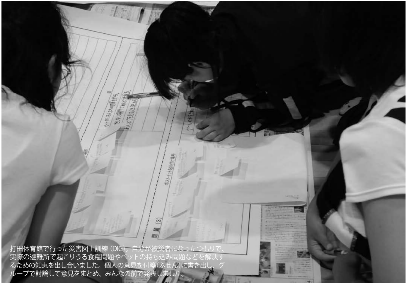
打田体育館で行った災害図上訓練（DIG）。自分が被災者になったつもりで、実際の避難所で起こりうる食糧問題やベットの持ち込み問題などを解決するための知恵を出し合いました。個人の意見を付箋（ふせん）に書き出し、グループで討論して意見をまとめ、みんなの前で発表しました。