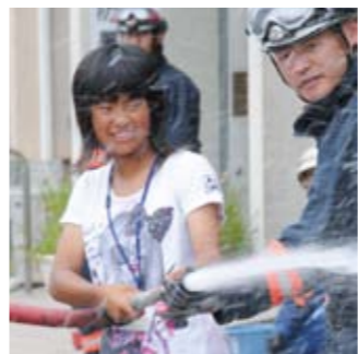
（写真左）直径40mmのホースを使用した放水訓練。 （写真中）地震に備え、転倒防止ポールでタンスを固定する。L型金具を用い、木（もく）ねじて壁と家具の天板の固定を行う練習も行った。 （写真右）那賀消防組合の司令室を見学。