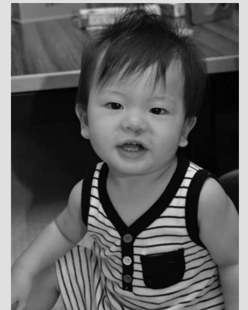
8月9日 赤ちゃん広場