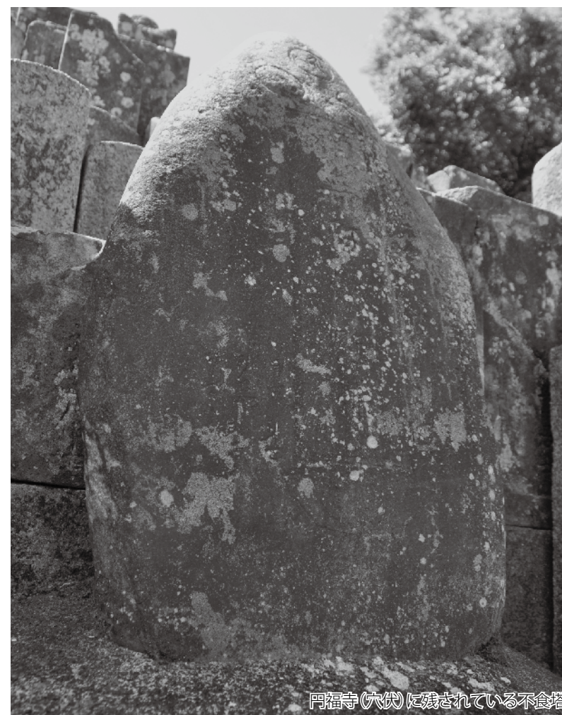
円福寺(穴伏)に残されている不食塔

しかし、厳しい修行も、年代とともにだんだん女性たちの団らんの場となっていきました。旦那や家族のことなどが話題となり、ストレス解消の場になっていったようです。現在、不食講は行われていませんが、当時の石塔が紀伊・和泉・河内に多く残され、中でもこの紀の川市