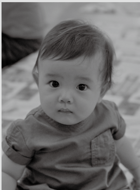
8月9日 1歳児健康相談