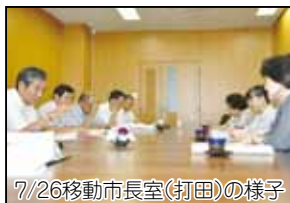
7/26移動市長室(打田)の様子

■移動市長室を開設 10月2日(木)に、市長が粉河支所 で執務を行います。 ※時間は午前9時～午後3時 ■地域振興課 (Tel. 77-0894) 粉河支所 (Tel. 77-3311)