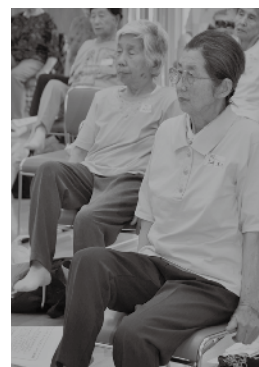
8月8日 いきいき元気塾