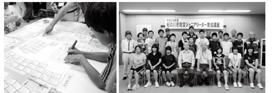
（写真）避難所運営ゲーム【HUG】 避難者の年齢・性別・国籍などそれぞれが抱える事情が書かれたカードを、体育館や教室など避難所に見立てた平面図にどれだけ適切に配置できるか、また避難所で起こる様々な出来事にどう対応していくかをグループで模擬体験しました。

段から防災学習を受けていた小中学生たちは、激しい揺れがおさまると、即座に避難を開始。釜石市内のほとんどの小中学生は押し寄せる巨大津波から逃れて無事でした。 今回の貴重な体験を生かし、災害時には自分や家族の身を守りながら地域にも貢献してくれることを期待しています。