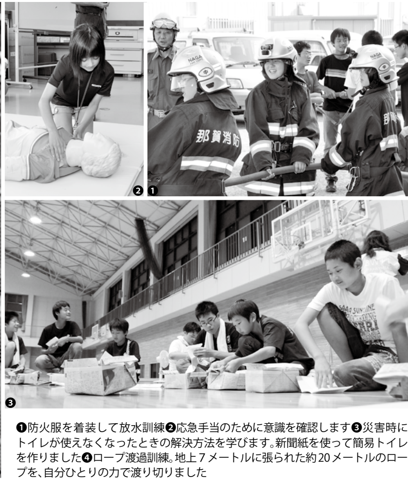
①防火服を着装して放水訓練②応急手当のために意識を確認します③災害時にトイレが使えなくなったときの解決方法を学びます。新聞紙を使って簡易トイレを作りました④ロープ渡過訓練。地上7メートルに張られた約20メートルのロープを、自分ひとりの力で渡り切りました