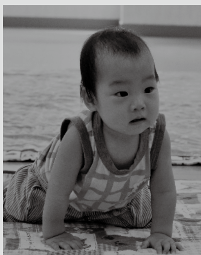
8月9日 1歳児健康相談