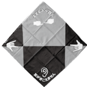
聴覚障害者・手話通訳者であることが分かる目印（バンダナなど）をつけてもらう方法もあります。