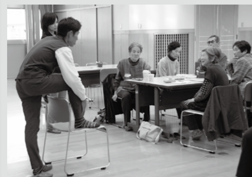
▲12月8日の「ひなたぼっこ」では、理学療法士による外反母趾防止の説明会を行いました。