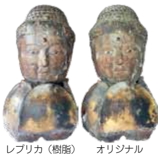
レプリカ(樹脂) オリジナル