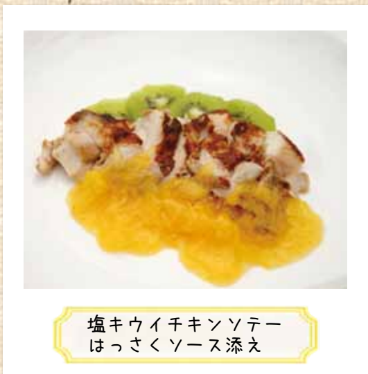
塩キウイチキンソテー はっさくソース添え