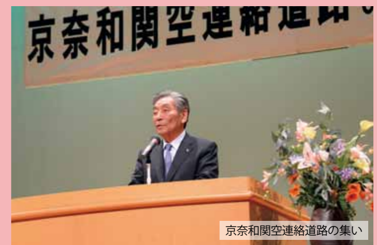
京奈和関空連絡道路の集い