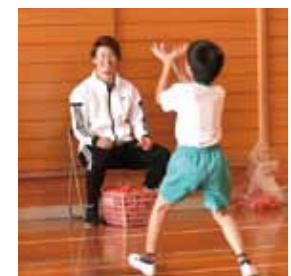
▲西川選手から母校の児童へホームルトス！他にも、強い体を作る食事のルールなど、食とスポーツを存分に学びました。

11月30日、西貴志小学校で「食とスポーツ教室」が開催され、小学5～6年生135人が参加しました。講師としてサプライズで登場したのは、北海道日本ハムファイターズの西川遥輝選手。「応援している選手が目の前に現れて、びっくり！」と喜び子どもたちと一緒に、平均台やマットを使った運動プログラム、股割りなどの野球運動を体験。西川選手は「スポーツを通して、チームワークや相手のことを思いやる心を学んでほしい」と話してくれました。