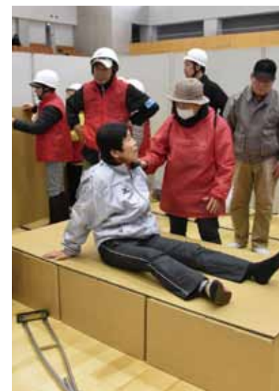
▲避難所設営訓練では、ダンボールベッドの組み立てや間仕切りを行うなど、スタッフと参加者が一緒になり、避難所の設営と運営の手順を学びました。

※ WIDA…県内の民間企業や各種団体、地方公共団体などが連携して地域の情報化を推進する会