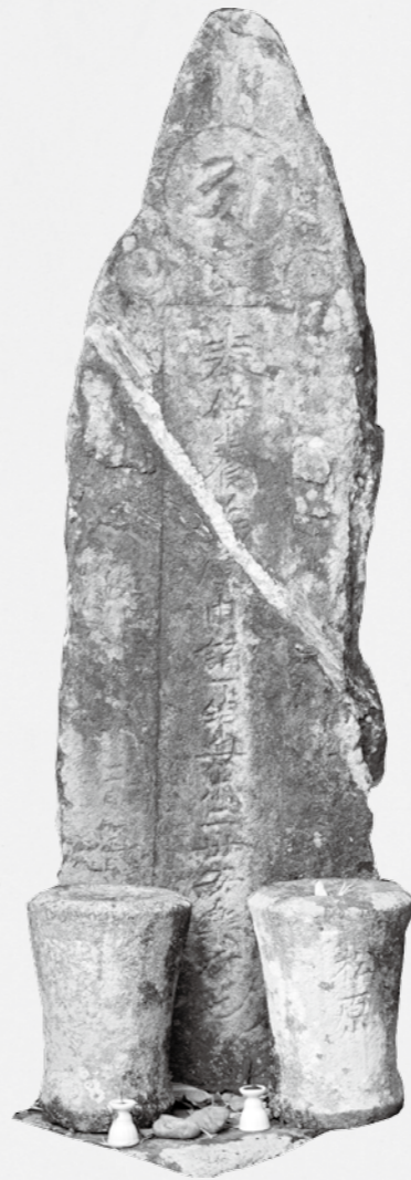
粉河寺に残る庚申塔

庚申信仰は、庚申の日を禁忌とする信仰で、3世紀頃の中国の道教の教えが起源といわれています。 庚申の日は、人の頭の中にいる三戸という虫が、人の眠っているうちに抜け出して天に昇り、閻魔大王にその人の悪行を報告します。悪行が多くなると、閻魔大王はその人の寿命を終わらせるという教えから、十干・十二支を組み合わせて60日に1度回ってくる庚申の夜を、人々は恐れ眼らなかつたそうです。 この教えは、8世紀の後半頃に日本に伝わり、平安時代には貴族社会に、鎌