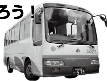
地域創生課（Tel 77・2511 本庁3階）

そこで、このバスの魅力をさらに知っていただくため、両市と運行事業者が協力して無料乗車券を作成しました。2枚分掲載していますので、2人の片道でも1人の往復でも利用できます。