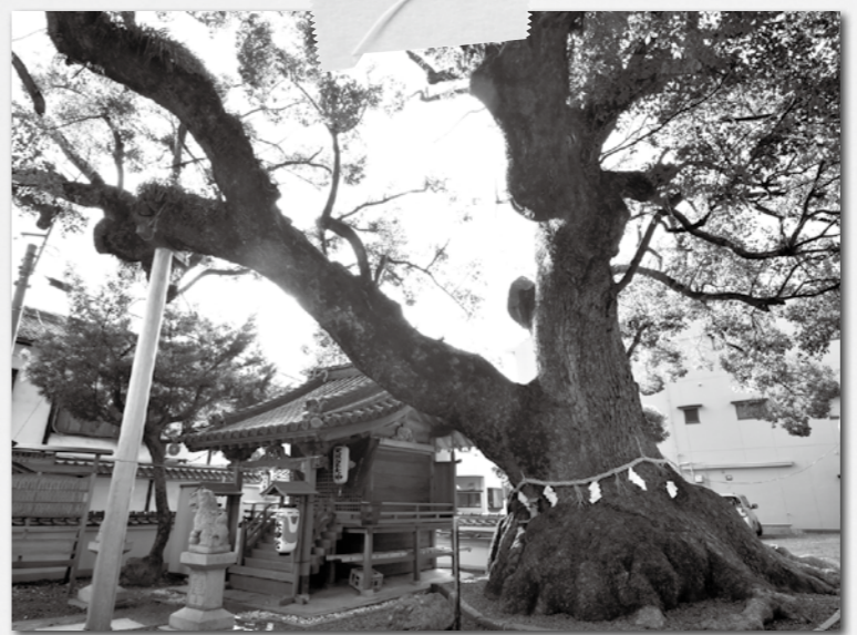
▲大神社のクスノキ

県内の天然記念物といえ、巨木のクスノキがあります。今回は、粉河寺の近くにある市指定天然記念物のクスノキを紹介します。 JR粉河駅の北方に位置する西国三十三所霊場第3番の粉河寺。駅から徒歩で北へ約15分、距離にして800m程度です。駅から北向きにしばらく歩いていると、左手に地藏菩薩があらります。それから間もなくすると、前方に和泉山脈が見えてきます。和泉山脈の手前に見える朱塗りの門は粉河寺大門です。この大門の屋根を半分隠しているのが、市指定天然記念物のクスノキの枝葉です。 大門の南を流れる中津川に架かる赤い「だいまんはし」を渡ると、左側の塀の向こうにクスノキが威風堂々と立っており、江戸時代の『紀伊続風土記』にもその巨大さが記載されています。