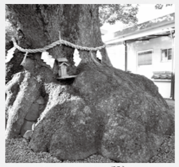
▲立派な根元には、小さな祠があります。

クスノキは神社の境内にあり、鳥居の少し奥の扁額には「大神社」の文字が並びます。神社の前の看板には、「お気軽に境内に入りパワーをいただいで下さい」という言葉があり、その言葉に促されて進むと、社殿の右手に、しめ縄が懸かった巨大なクスノキが現れ、圧倒されます。木を見上げると、切断された大きな跡が2か所残っているほか、小さな切断跡も見られます。根元は神力たくましく、塊状となるみごとな巨樹の、まさに神木です。 近所に住む女性が、お嫁に来て以来毎日、氏神様を拜み、掃除をしているそうです。一度、雷が木に落ちて火柱がたったこともあるそうですが、幸い幹は燃えなかつたと教えてくれました。その女性は90歳近いものの、まだまだ元氣はつらつと、その元氣はクスノキの力のおかげなんだろうな