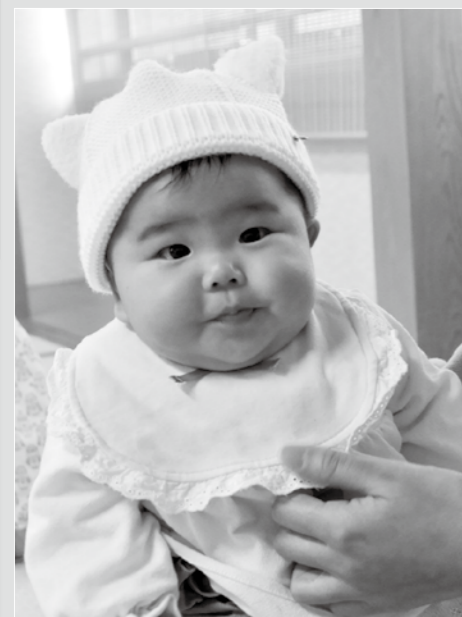
1月22日 4か月児健康診査

【問い合わせ】 社会福祉協議会粉河支所 (Tel 73・8863) 高齢介護課 (Tel 77・2511)