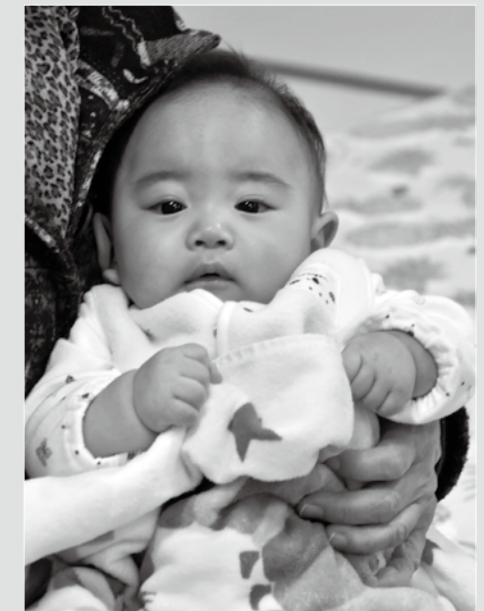
1月22日 4か月児健康診査