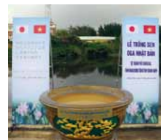
▲ベトナムの高校生と共に粉河高校生もハスを植樹。◀フック首相が見守る中、互いに友好を誓いました。