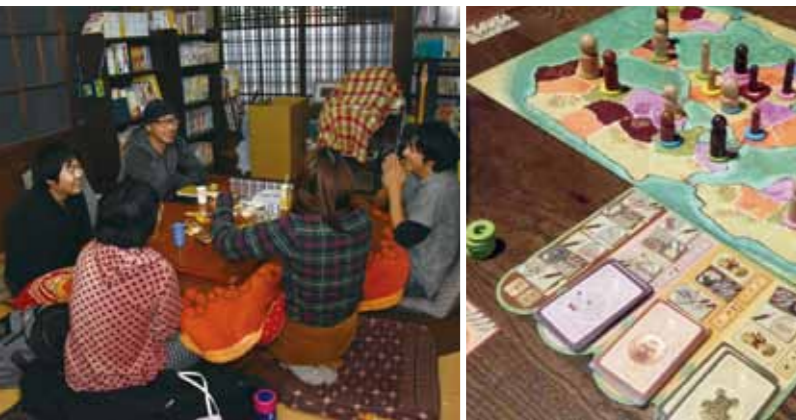
(上)粉河駅前にあるハートフルハウス創。(左下)創に設けられている「居場所」には、漫画やボードゲームなどが置かれ、利用者が思い思いの時間を過ごすことができます。(右下)120種類以上のボードゲームを備え、仲間が集まればすぐにゲームを始められます。