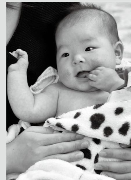
1月22日 4か月児健康診査