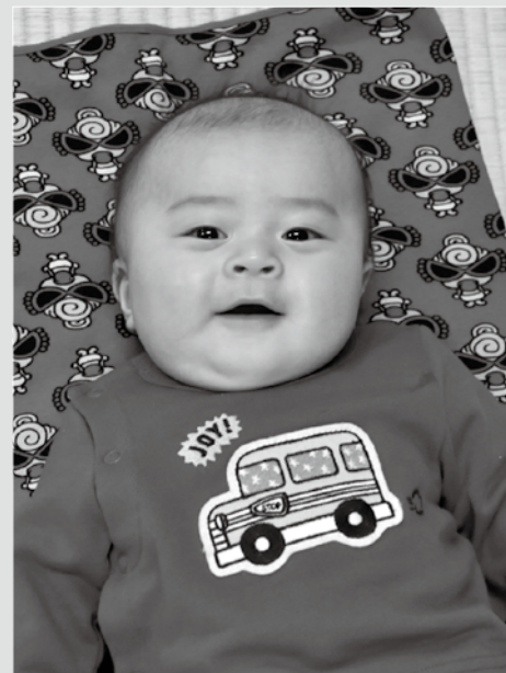
1月22日 4か月児健康診査