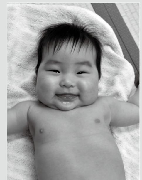
1月22日 4か月児健康診査