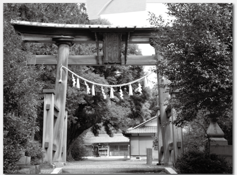
明神鳥居から見る丹生神社

中世、上丹生谷地区と下丹生谷地区は丹生屋村といわれる一つの村で、粉河寺領でした。上丹生谷にある丹生神社の祭神として厳島明神・丹生明神・高野明神・気比明神が祭られ、山上にあった奥四社明神に対して麓の四社明神ともいわれ、太社として、太神宮や熊野社・荒神社など11の社などが祀られています。