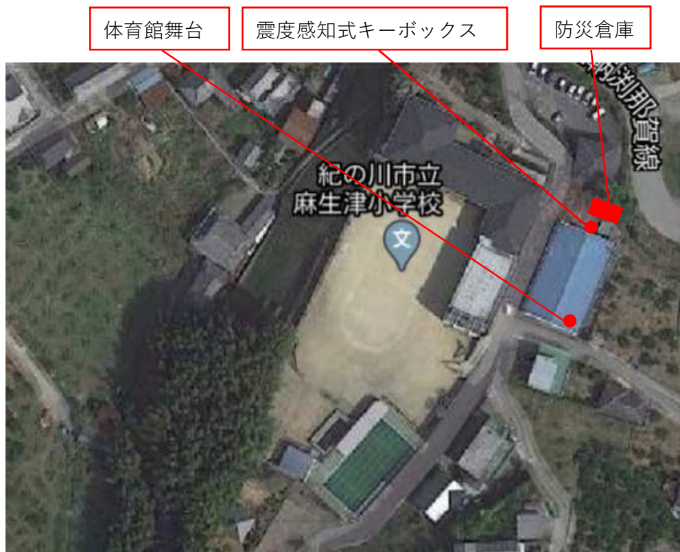
震度感知式キーボックス・防災倉庫位置