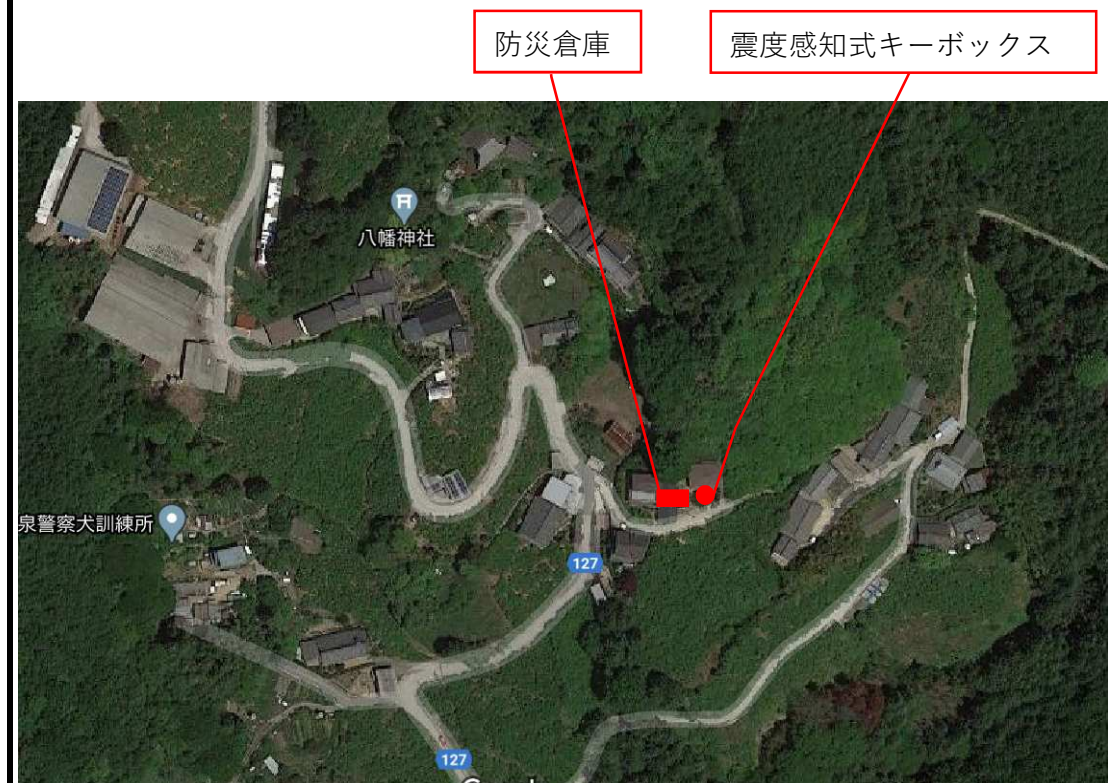
震度感知式キーボックス・防災倉庫位置