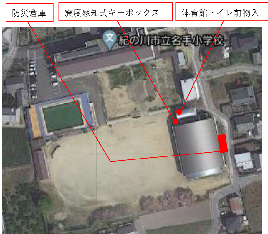
震度感知式キーボックス・防災倉庫位置