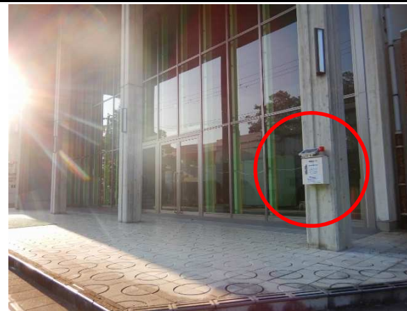
震度感知式キーボックス