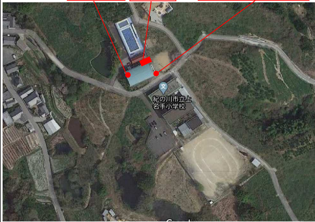
震度感知式キーボックス