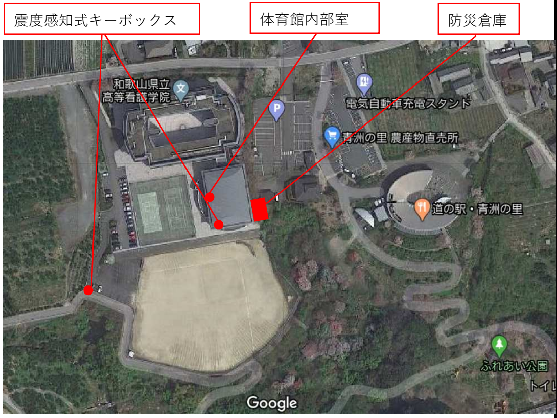
震度感知式キーボックス・防災倉庫位置