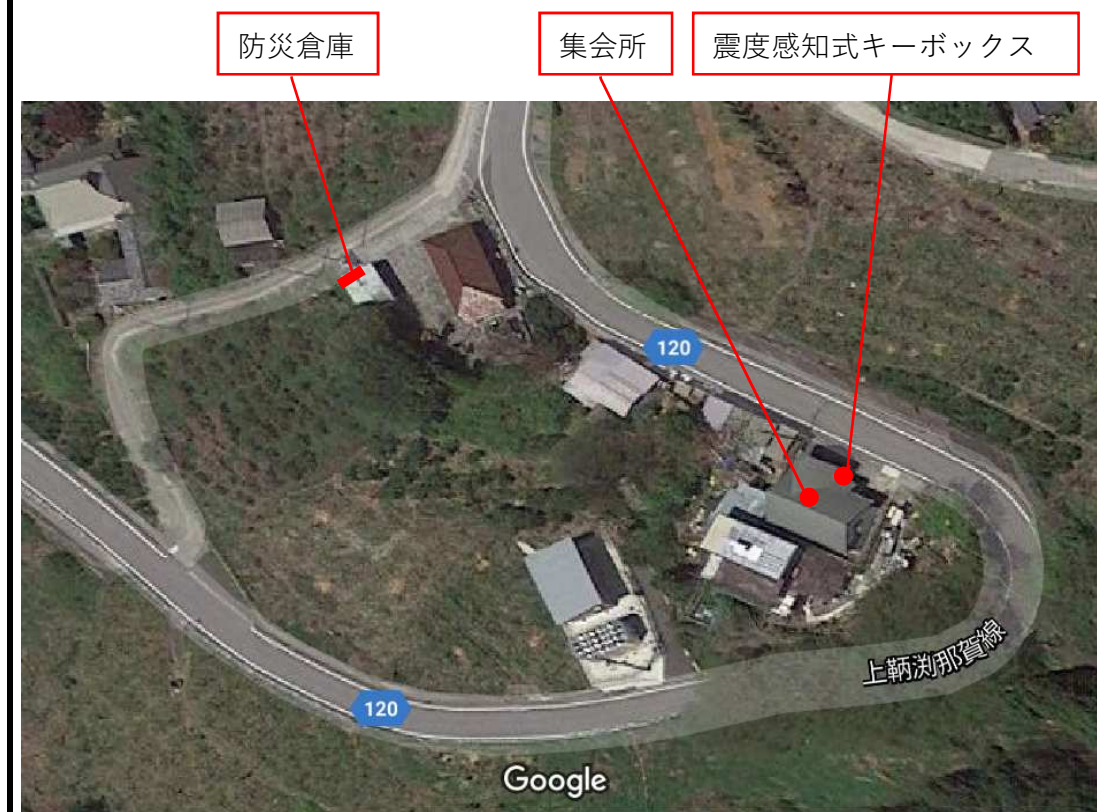
震度感知式キーボックス・防災倉庫位置