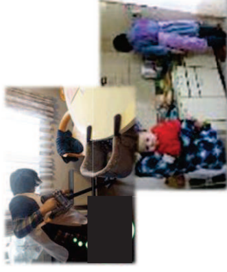
家事支援のイメージ

※所得等に応じた利用者負担軽減を行った場合には、訪問支援費用及び交通費について補助額の加算を実施。 括弧書きは生活保護世帯に対して利用者負担軽減を実施した場合の補助基準額