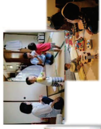
育児支援のイメージ