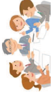
協議の場等の開催