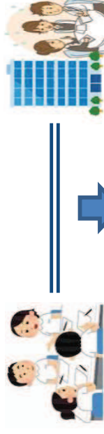
居宅介護支援事業所等