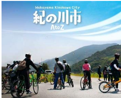
第2期生作製「紀の川市AtoZ」