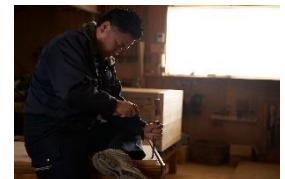
有限会社家具のあづま