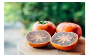
黒くて甘い紀の川柿をご賞味ください！

たねなし柿を樹にならせたまま、袋をかけ、固形アルコールを入れて、渋を抜き、じっくりと時間をかけ熟成させてから収穫します。黒い果肉が特徴で、パリッとした食感の後にジュワーっと甘みが広がります。