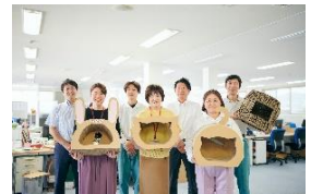
濱田紙販売株式会社