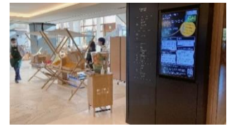
3月のはっさくマルシェの様子