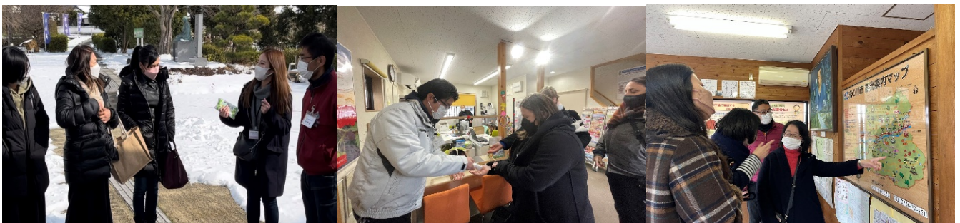
お客様ご案内イメージ