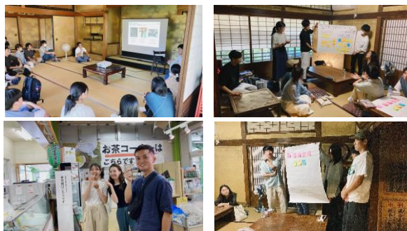
↑ 和歌山大学生フィールドワークの様子