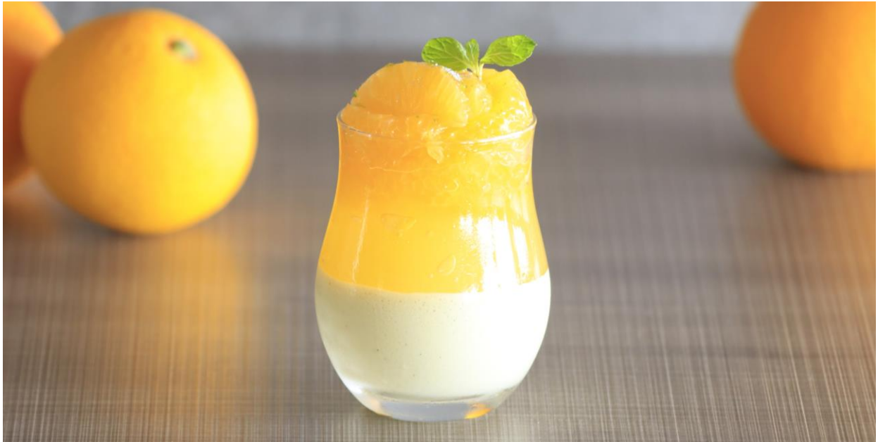
（写真）紀の川はっさくを使用した「はっさくのヴェリーヌ ピスタチオの香り（700円）」

和歌山県紀の川市（市長：岸本 健）は、4月6日（土）～7日（日）の2日間、生産量日本一を誇る はっさくのPR を切り口に、 ふるさと納税返礼品マルシェ を開催します。