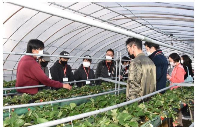
▲昨年度開催された体験研修会の様子