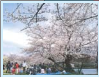
大池遊園 (貴志川町)