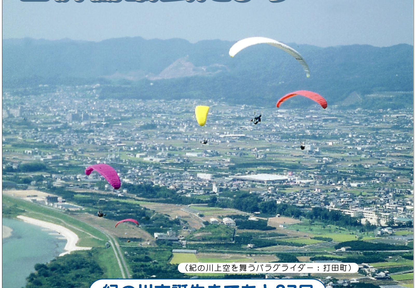
(紀の川上空を舞うパラグライダー：打田町)