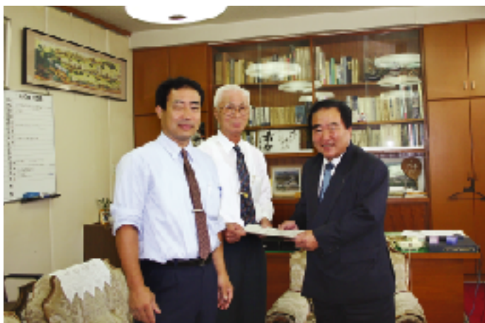
【会長に答申書を提出する宇田委員長(中央)・上野副委員長(左)】