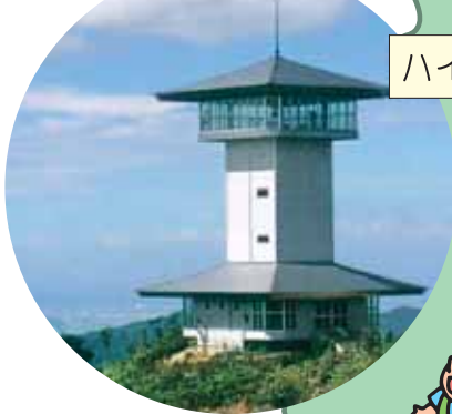
ハイランドパーク