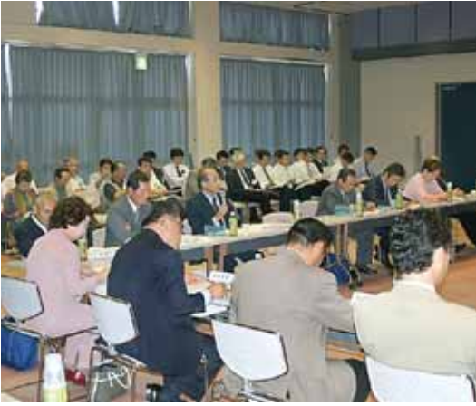
地方税の納期調整方針（案）