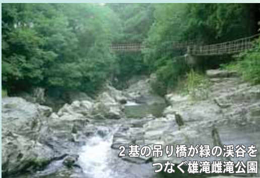
2基の吊り橋が緑の渓谷をつなぐ雄滝雌滝公園

雄滝雌滝が、秘文の滝と呼ばれる由来を伝える話も残っています。昔、日照りに農民が苦しむ姿を見た高野山の僧が、滝壺にむかって雨乞いの秘文を唱えたところ、雷鳴とともに大雨が降りました。これに感謝した里人は、この滝を秘文の滝と呼び、雨乞いの場所として、魚を取るのが禁じたということです。