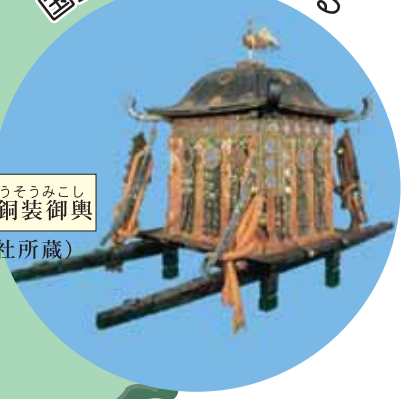
いかけしらでんこんどうそうみこし 沃懸地螺鈿金銅装御輿 (鞆八幡神社所蔵)