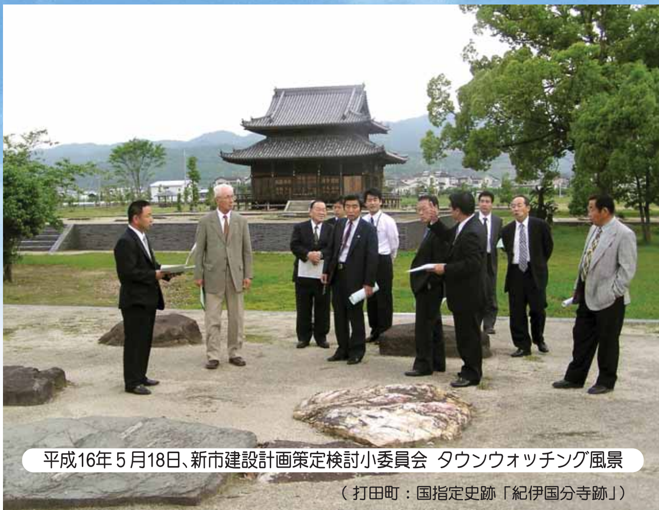
平成16年5月18日、新市建設計画策定検討小委員会 タウンウォッチング風景