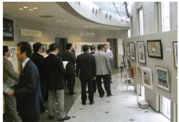
那賀町：青洲の里（フラワーヒルミュージアム）