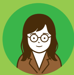
東京在住の クリエイティブディレクター