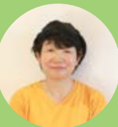
《ダイマル農園》 ゴマ、豆、みかん農家

フィールドワークを通して、事前に考えていたアイデアと生産者が 推し出したいポイントにギャップがあることが分かり良かった。