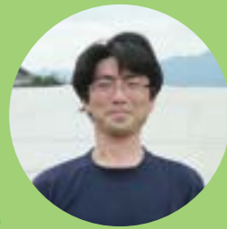
《米もと農園》 ハーブ農家