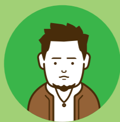
沖縄県在住の デザイナー・ディレクター