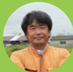
《かたやま農園》 黒米、桃、はっさく農家

実際に現場を訪れることで多くのインプットがあった。 また他の生産者やクリエイターとの交流で良い刺激を貰えた。