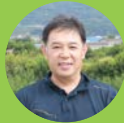
《ハ旗農園》 桃、キウイ農家

いよいよ販売に向けて準備をするぞというタイミングで参加し、自分の予想以上のアイデアにしていけました。今後にも活かせる いい経験になりました。ただいま販売に向けて動いていますが、紀の川市から次々に出る商品に負けたくないよう、頑張っていきたいです。