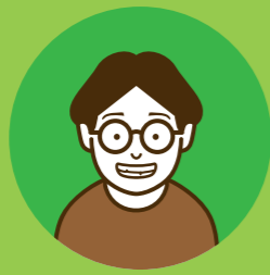
東京在住の クリエイティブディレクター