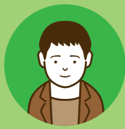
東京在住の プロダクトデザイナー