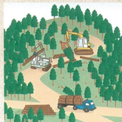
適切に森林整備を推進！

ことから、森林の土地の所有者の把握を進めるため、平成24年4月から森林法に基づく森林の土地の所有者となった旨の届出制度が創設されました。なお、この届出により、森林の土地の所有権の帰属が確定されるものではありません。