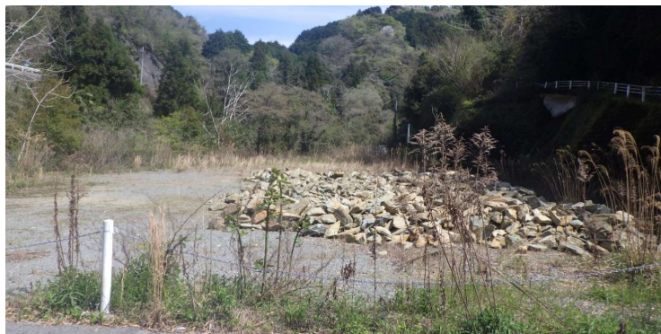
①道路より東側 奥に基地局が見える