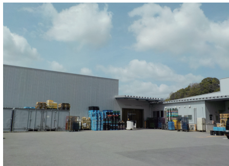
和歌山センター全景