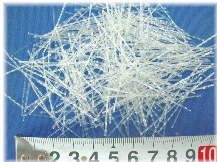
【和歌山県認定リサイクル製品登録】 コンクリート・モルタル補強用PET(R)非鋼繊維 『テレフタロンAC』

「ひし形金網」・「クリンブ金網」・「各種エキスパンドメタル」・「法面緑化用型枠」の製造販売 「コンクリート・モルタル補強用PET(R)非鋼繊維」の製造販売