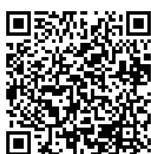
ふるさとチョイス